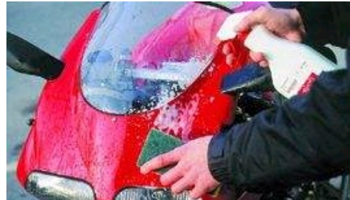
Insekter har det med at gro fast på motorcyklens front. De døde dyr kan opløses med flydende insekt rens og fjernes med en blød svamp.

Tilbage er blot at give kæden en frisk gang kædespray og at fedte bremseeskiverne af med en klud, som er fugtet med husholdningssprit.